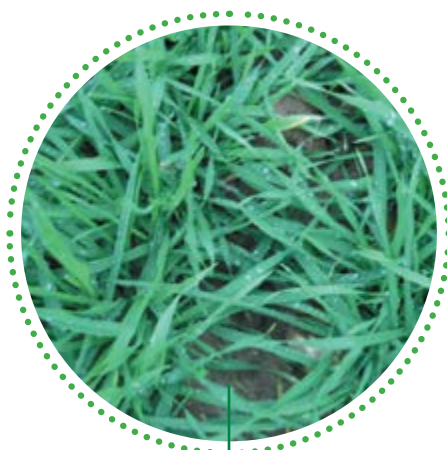
Systiva® + Premis® 25 FS