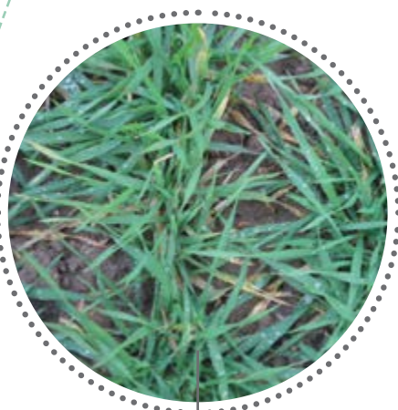
Témoins - TS de référence

Efficacité de Systiva® en début de cycle sur orge d'hiver (semis de l'automne 2020 - Lorraine)